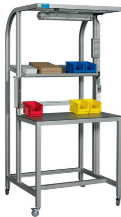
Chariot de transfert de pièces